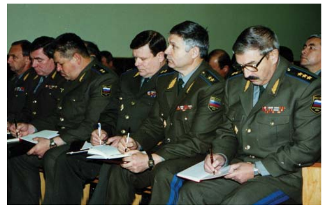
50 ЛЕТ КАФЕДРЕ ВДВ