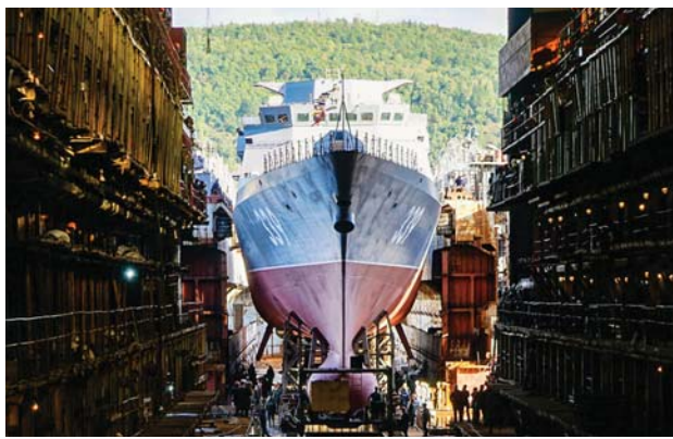
КОРВЕТ С ИМЕНЕМ ГЕРОЯ