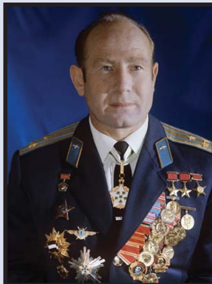
Леонов Алексей Архипович (30.05.1934–11.10.2019)

Полный кавалер ордена «За заслуги перед Отечеством», главный режиссёр театра «Ленком».