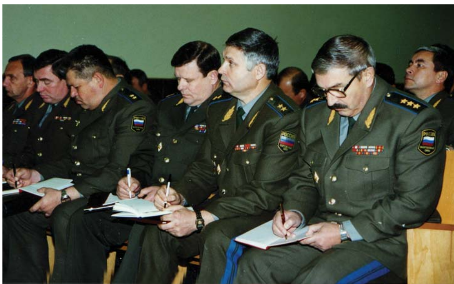
Генералы – выпускники кафедры ВДВ им. М.В. Фрунзе