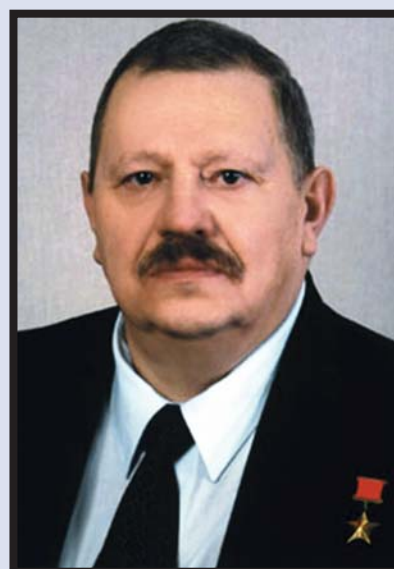
Исаков Михаил Иванович (12.11.1946–07.10.2019)

Герой Советского Союза, лётчик-космонавт СССР, полковник. Совершил два космических полёта (общая продолжительность: 309 суток 21 час 18 минут), три раза выходил в открытый космос.