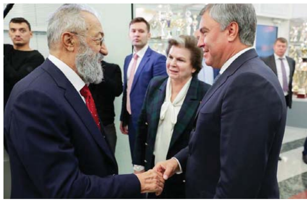
АРТУРУ ЧИЛИНГАРОВУ – 80